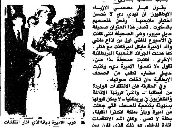
توب الاميرة ديانا التي اثار انتقادات الصحف الإيطالية

تأملت الصحف البريطانية أمس بصورة كبيرة الانتقادات التي وجهها خبراء الموضة الإيطاليين الى الاميرة ديانا - التي تزوجت ايطاليا حالياً برفقة الأمير تشارلز - لتبدأ حملة تدافع عن العائلة المالكة التي تلوث شهرتها مؤخراً بسبب صلاتها بالنازي.